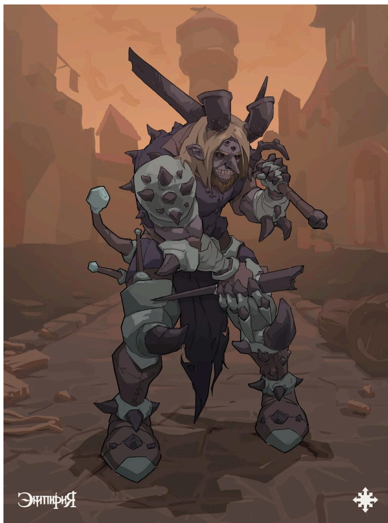
Вектор де Винтер